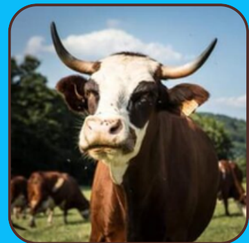
LA METAIRIE BASSE

Cliquez sur l'image pour les rejoindre et commander les produits de la vallée du Thoré ! (poulets, pintades, bœuf, veau, agneau, lait, fromages...)